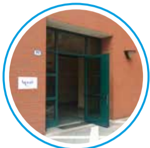
SEDE DI PADOVA