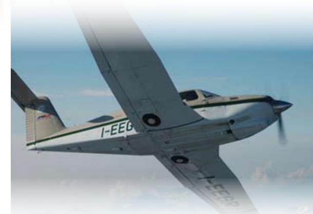
Velivolo impiegato per i voli su ala fissa

Nel biennio tutti gli alunni effettuano dei voli di ambiente su aereo e su elicottero con piloti istruttori certificati. Tali voli vengono svolti grazie ad una solida partnership con l'Aeroclub di Varese presso l'Aeroporto di Venegono per i voli su aeroplano, ed Eurotech, azienda leader per l'ala rotante, per i voli su elicottero.