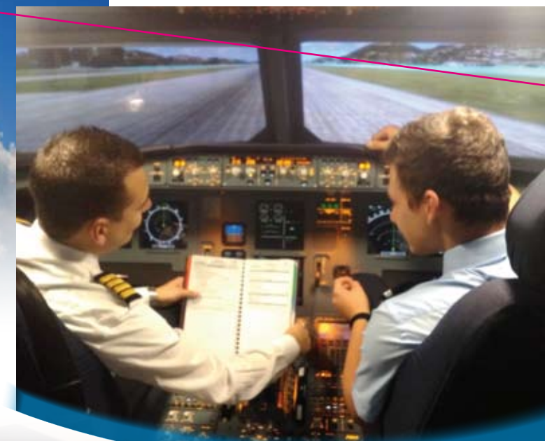
Simulatore di volo Airbus A320 impiegato per i corsi di orientamento Jet

La nostra Scuola propone altresì per gli allievi del quarto e quinto anno un corso unico ed innovativo in Italia di orientamento su velivolo JET di linea plurimotore . Tali corsi, tenuti da un Pilota Professionista, sono svolti grazie alla partnership con FlyVergiate sul simulatore del velivolo commerciale più avanzato del mondo: l' Airbus A320 . Lo stesso simulatore è impiegato da una Scuola di Volo nota a livello internazionale per l'addestramento dei Piloti di Linea.