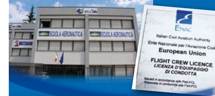
La nuova sede di Varese

Dal terzo anno gli allievi hanno la possibilità di conseguire la Licenza di Pilota Privato di Aereo PPL-A o Elicottero PPL-H tramite corsi ad hoc promossi dall'Istituto e svolti in sinergia con le scuole di volo già citate. Il corso che comprende 45 ore di volo oltre a 100 ore di teoria, consente agli allievi che ottengono la licenza di pilotare aerei od elicotteri con la funzione di Pilota in Comando, trasportando passeggeri non a scopo di lucro. L'esame finale può essere sostenuto già all'età di 17 anni.