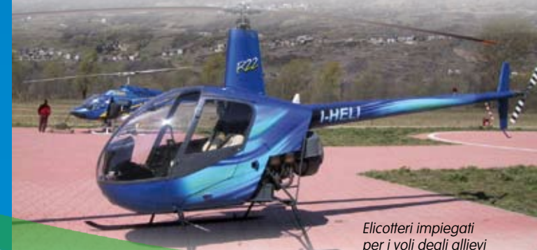
Elicotteri impiegati per i voli degli allievi

Il diploma, riconosciuto dal Ministero dell'Istruzione, è valido e fornisce una solida preparazione per l'iscrizione a tutte le facoltà universitarie.